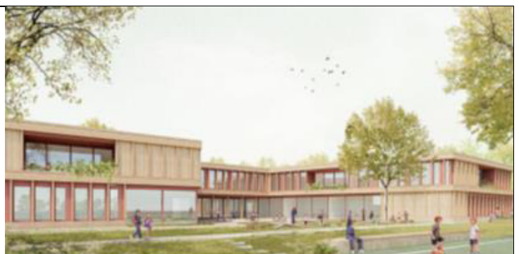
Willi-Fährmann-Schule Martin-Luther-Straße 14 52249 Eschweiler