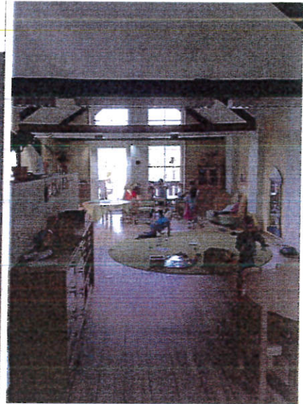
Sicht vom Außengelände in Richtung Turnraum