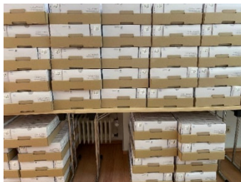
(© Christina Kral) Foto: Im Konferenzraum der Kreisgruppe gelagerte Schnelltests