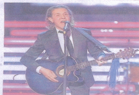
Die Headliner des Eschweiler Music Festivals: Albert Hammond (links unten) eröffnet den Konzertreigen am 15. August auf dem Marktplatz mit Oldies. Boney Fields (oben) und The Bone's Project setzen am Festival-Samstag den Soul- und Jazz-Express unter Dampf. Zum Abschluss rockten Paddy Murphy aus Irland die Innenstadt.