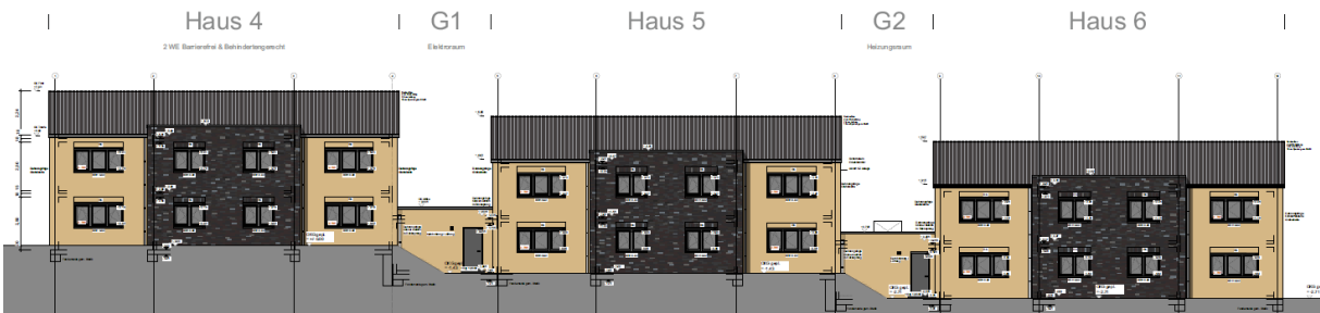
Neubau Hüttenstraße 2. BA - Vorderseite

Die nachfolgenden Bilder zeigen die Planentwürfe für die Häuser 4 bis 6: