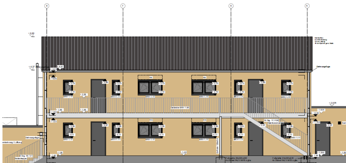
Neubau Hüttenstraße Haus 5 - Rückseite