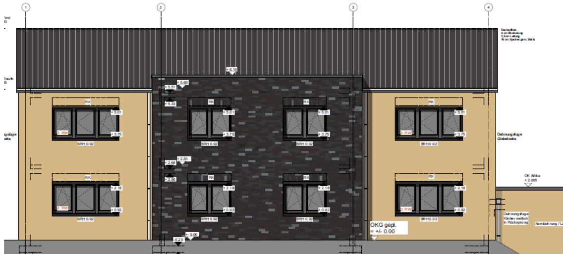
Neubau Hüttenstraße Haus 4 - Vorderseite