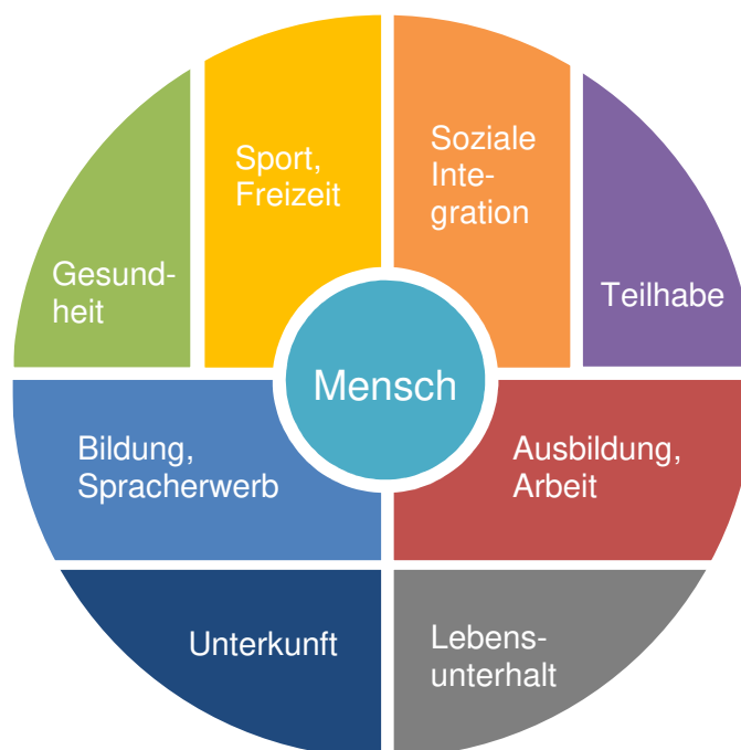
Abb. Implementierung des lebensweltlichen Ansatzes

nahmegesellschaft organisiert werden können, um einer gleichberechtigten Integration und Teilhabe näher zu kommen.