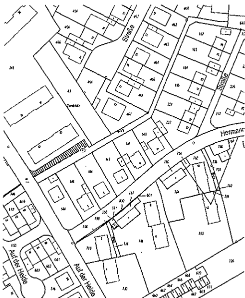
(Flurkarte des Kreises Aachen. Dieser Plan ist urheberrechtlich geschützt.)

Die Lage der einzuziehenden Teilfläche des öffentlichen Weges ergibt sich aus dem nachstehend abgedruckten Kartenausschnitt.