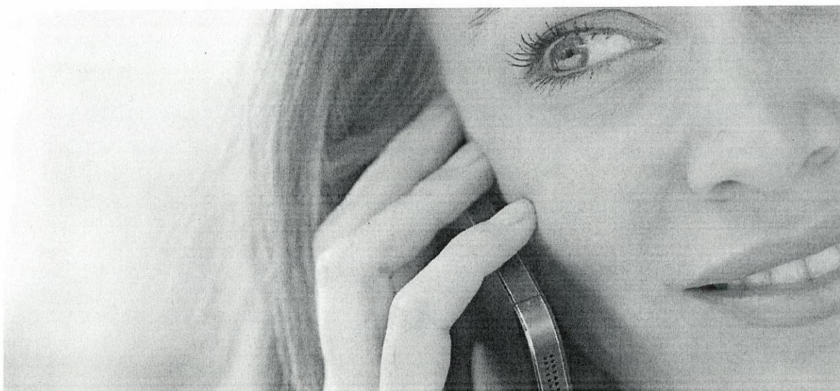
Am höchsten ist die Exposition des Kopfes bei der direkten Nutzung des Mobiltelefons am Ohr.