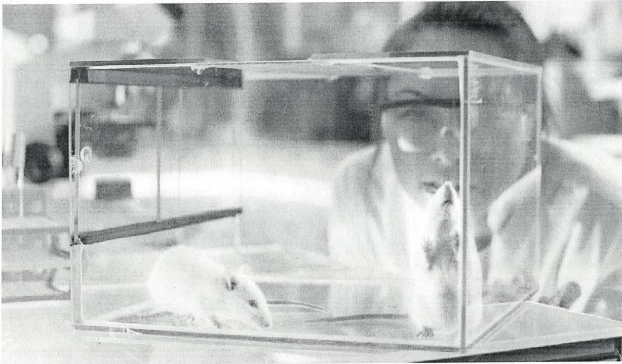
Tierexperimente zur Untersuchung von Krebserkrankungen durch Mobilfunk.

eines solchen Risikos zwar nicht wahrscheinlich ist, aber wegen Einzelhinweisen auch nicht ausgeschlossen werden kann. Ein ursächlich zugrunde liegender Wirkmechanismus ist nicht bekannt. Auch ist bisher kein auffälliger Anstieg der Inzidenzraten von Kopf-tumoren in den nationalen Krebsregistern festzustellen. Das BfS verfolgt weiterlaufende Studien zu diesem Thema und vergibt Forschungsvorhaben.